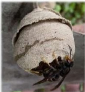
La fondatrice édifie seule un nid de fondation dit « nid primaire »

Sphère suspendue avec une petite ouverture vers le bas