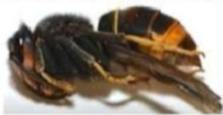
Gyne FA en dormance pendant la phase hivernale