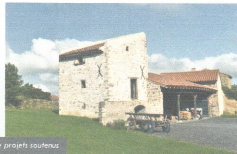
Exemples de projets soutenus

PROPRIÉTAIRES PRIVÉS, vous pouvez défiscaliser le montant de vos travaux de restauration ou obtenir jusqu'à 20% de subvention.